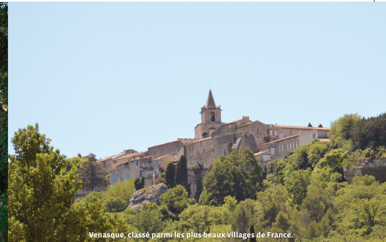
Venasque, classé parmi les plus beaux villages de France.

Balilage : PR (jaune) / GRP (jaune et rouge)