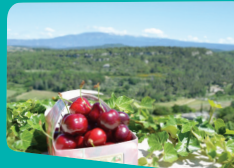
La délicieuse cerise de Venasque.

La cerise des Monts de Venasque , leader de la cerise haut de gamme. Appelée aussi diamant rouge pour sa saveur juteuse, sa forme charnue et son goût craquant, on la trouve dès le mois de juin sur les marchés et chez les producteurs locaux.