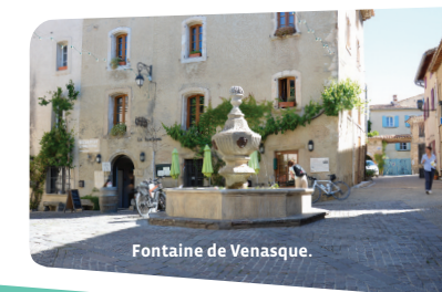
Fontaine de Venasque.

6 A la sortie des gorges, dépasser le panonceau « Fonds de Nesque - 221 m », et 150 m plus loin, remonter à droite par la Combe du Diable balisée en jaune. La montée est raide et le sentier escarpé : prudence ! Ce sentier balisé s'adoucit pour vous ramener au parking.