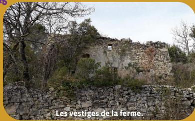
Les vestiges de la ferme.

Venasque , classé plus beau village de France et son Baptistère.