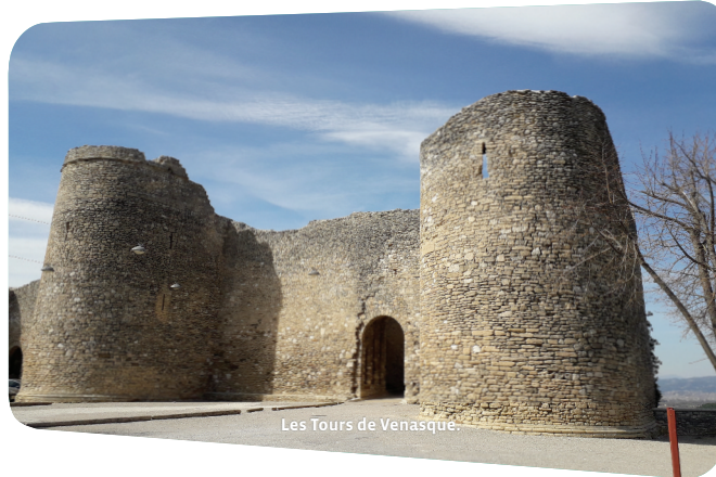
Les Tours de Venasque.

Les ruines de la ferme de la Pérégrine (entre les points 2 et 3)