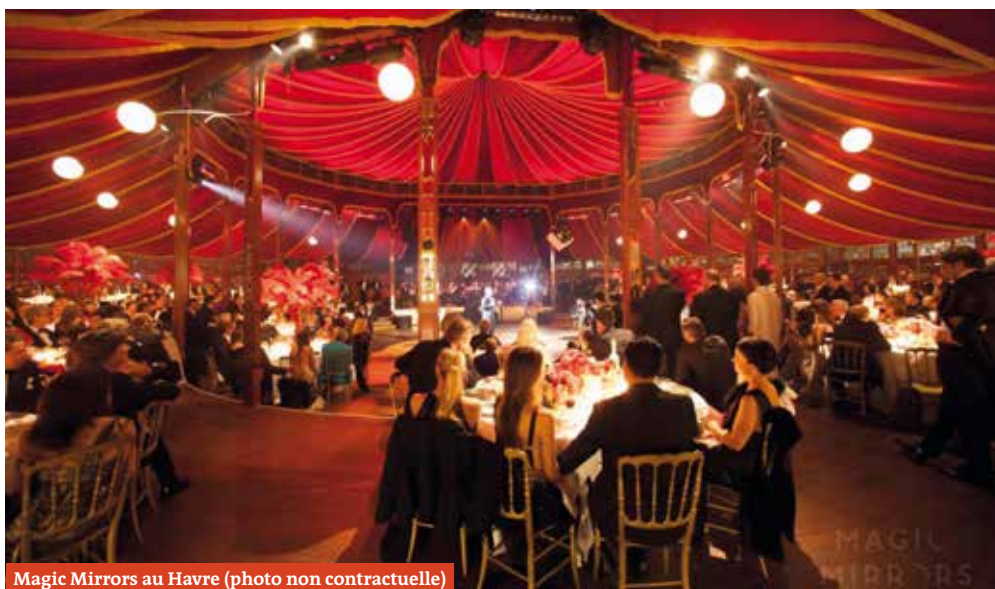
Magic Mirrors au Havre (photo non contractuelle)