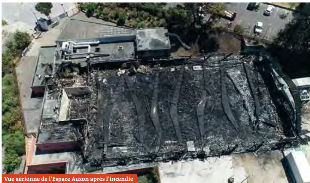
Vue aérienne de l'Espace Auzon après l'incendie

Véritable salle de spectacles d'une capacité de 950 personnes debout, et d'environ 500 personnes en configuration assise, le Cabaret sera notre lieu de rendez-vous à tous. En effet, il présente l'avantage de s'adapter à tout type d'événements et de publics, des plus jeunes aux séniors.