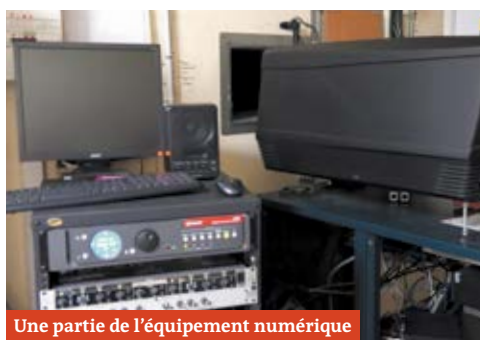
Une partie de l'équipement numérique