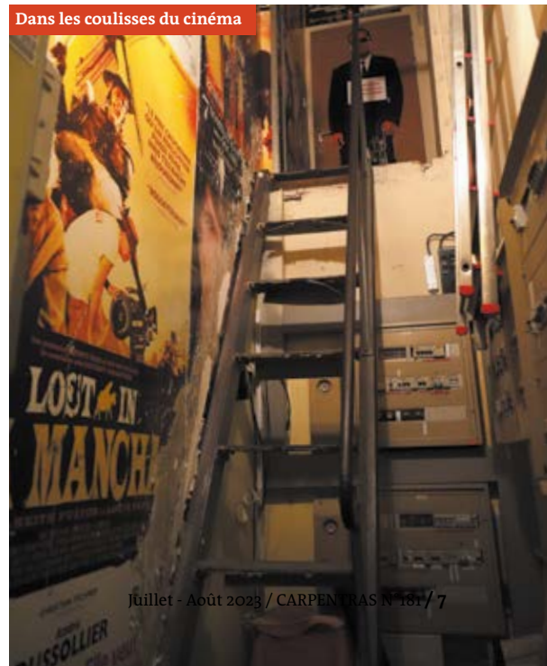
Dans les coulisses du cinéma

Au total, les professeurs bénéficient d'un film par trimestre dans une démarche volontariste. Les séances ont lieu le matin au Rivoli et les élèves s'en réjouissent.